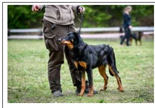
Velmi nadějná 2