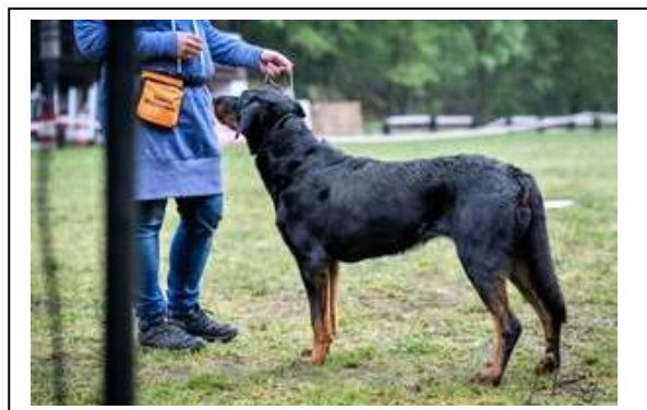
Výborná 2, r. CAC

4 letá fena, pěkná hlava, krásný temperament, dobře úhlená vpředu i vzadu, dobré tělo a kostra, tlapy trochu dlouhé, výborná srst, rovný ocas v postoji, dobře se pohybuje.