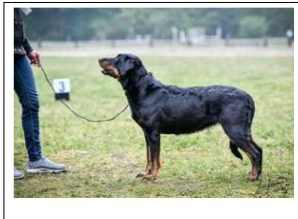
Výborná 1, CAC

5 letá fena výborného typu, fenčí hlava, tmavé oči, dobré uši a zuby a ramena, pěkné tělo, trochu slabá ve hřbetě, výborná zád', dobrý ocas, ale mezi nohama, výborná srst a barva, pohybuje se plynule.