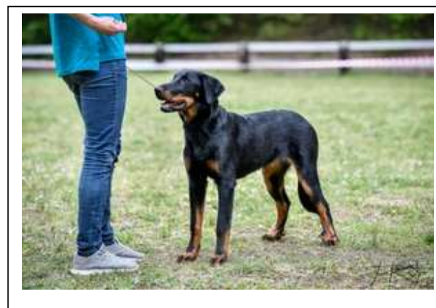
Velmi nadějná 3