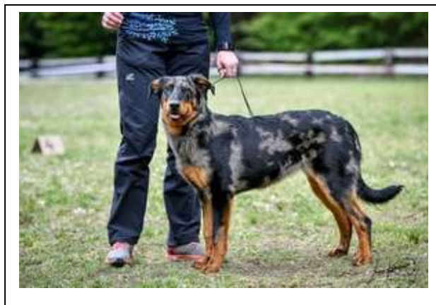
Velmi nadějná 1, Nejlepší dorost

Pěkná mladá fenka, 7 měsíců, hlava má paralelní linie, pěkné uši, tmavé oči trochu šikmo uložené, harmonicky stavěná, výborné tělo, pěkná srst a barva, pěkný dlouhý ocas, rovný v postoji, trochu výše nesený v pohybu.