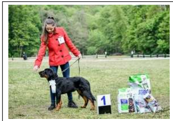
Velmi nadějný 1, Nejlepší štěně

Velmi pěkné štěně, není špatný v typu, krásná kostra, v tuto chvíli trochu přestavěný, zád' příliš skloněná, pohyb dle věku, velmi pěkná srst a ocas, pěkný temperament, velmi přátelský.