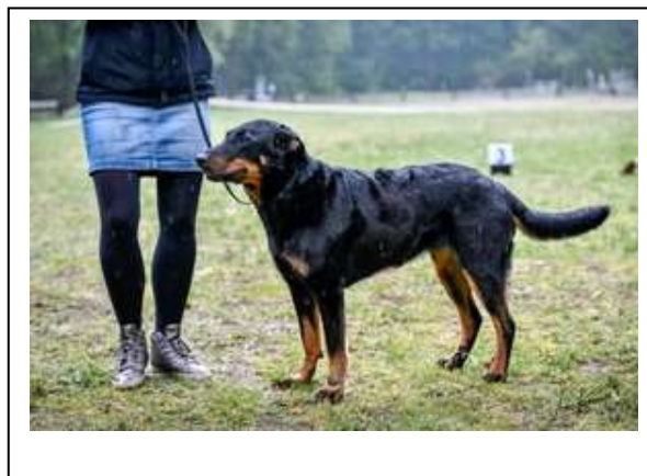
Výborná 1, CAC

Velmi pěkná 3 letá fena, fenčí hlava s dobrými liniemi, dlouhý stop, tmavé oči, malé uši složené do růže, dobré zuby, pěkně stavěná, dobré tělo a hřbet, zád' trochu moc skloněná, ocas dobré délky, dobrá srst a kostra, pálení světlejší s příměsí černé, plynulý pohyb.