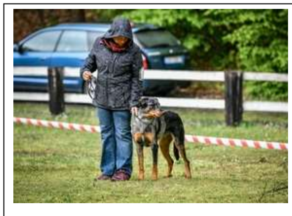
Velmi dobrá 4

Téměř 2 letá fena barvy harlekýn, která potřebuje silnější kostru, tělo potřebuje čas, krásné tmavé oči, malé nasazené uši, dobře úhlená vzadu, méně vpředu, dobré tělo, pohybuje se s elánem, ale měla by být lepší vpředu, pohyb úzký, trochu širší vpředu.