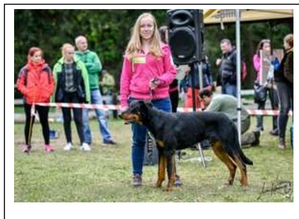
Velmi dobrý 3

15 měsíců starý, pěkný typ, dlouhá hlava, středně hnědé oko, kompletní nůžkový skus, ještě stále postrádá objem těla, ještě se rýsuje v přední části, dobrá zád' příliš skloněná, pěkná drsná srst jen s trochou podsady dobré délky, ocas trochu moc rovný.