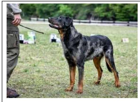
Výborný 2, r.CAC

3 letý pes harlekýn s krásnou hlavou, výborné paralelní linie, dobré uši, tmavé oči, rád bych viděl lepší pigmentaci v tlamě, rovné nohy, dobré tlapy, výborná srst a barva, pohybuje se s elánem, ale s dost vysoko neseným ocasem.